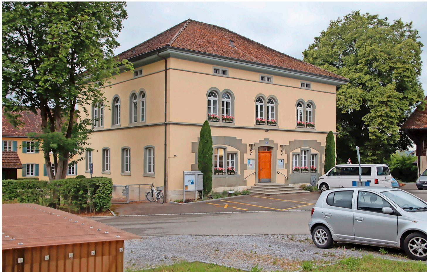
Das Benkemer Gemeindehaus wird neu mit einer von links zum Eingang führenden Rampe behindertengerecht erschlossen.

Das Projekt beinhaltet des Weiteren auch Verbesserungen beim Brandschutz. Mit einer seitlich am Gemeindehaus zu erstellenden Rampe und einem Treppenlift wird ein hindernisfreier Zugang entstehen. Der bisherige Gang im Erdgeschoss wird neu zum Empfang umgebaut, indem man mit dem Einbau eines Schalters den direkten